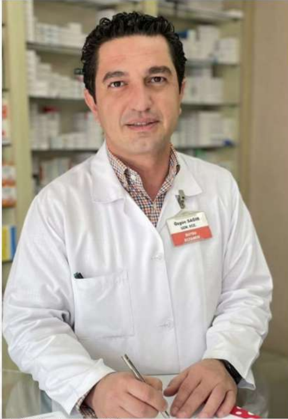
"Yanlış ifadeler sahada şiddet doğurdu"

İlaç fiyat farklarının arttığını söyleyen Sağır, "Gelen zamlarla beraber Sosyal Güvenlik Kurumunun ödeme politikasından kaynaklı olarak ilaç fiyat farkları çok daha fazla arttı. Bugün insanlar artık ilaç almakta zorlanıyorlar. İlaçlar hala yok kims e ilaçlar piyasaya çıktı demesini yok. Gidip eczaneden kontrol edebilirler. Diğer taraftan fiyat kararnamesinde herhangi bir değışiklik yapılmadı, eczacılar hala yoks ayılıyor. Bunun yanında Bakan bir toplantı yapıyor tüm s ektörler diyerek. Ama maales ef o s ektörün en büyük paydaşı olan eczacılar yok. Bizi yoks aydıkları süreçte bu sorunu çözüme şansı yok" şeklinde konuştu.